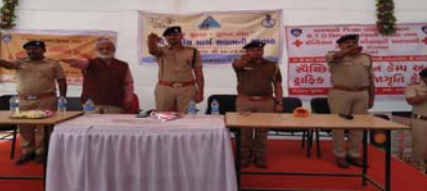
પ્રતિનિધિ અરવલ્લી અંતર્ગત વાહનચાલકોને વિવિધ જનજાગૃતિ કાર્યક્રમ યોજાઈ રહ્યા છે અરવલ્લી

હિંમતનગર તાલુકાના કાંકણોલ ગામે ત્રણ દિવસ અગાઉ બે કોમો વચ્ચે થયેલા ઝડપાએ ધિંગાણાનું સ્વરૂપ ધારણ કરતા પોલીસે ગુરૂવારે દસ જણ વિરૂધ્ધ હિંમતનગર ગ્રામ્ય પોલીસ સ્ટેશનમાં ફરીયાદ નોંધાવી હતી. જેમાં આલેખ કરાયો છે ત્યારબાદ સામા પહેલ પછ મોડેથી ૧૧ જણા વિરૂધ્ધ ફરીયાદ નોંધાવાતા પોલીસે બંને પક્ષોની ફરીયાદને આધારે આગળની નિયમ મુજબ ફે કે ત્રણ દિવસ અગાઉ પટેલો અને રણપુતો વિરૂધ્ધ ગાદી રિવર્સ લેવા બાબતે થયેલા ઝગડા બાદ પટેલ કોમના એક