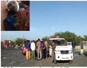
પ્રતિનિધિ અરવલ્લી મોડાસા-પનસરા રોડ પર આવેલા રાણાસૈયદ ચોકની જગતી નજીક જાનેયા ભરી પસાર થતી લકઝરી બસના ચાલકે મુસાફરોને લઘુશંકા માટે બસ ઉભી રાખતા લોકોની પર ઉભા રહેતા લારી-ફેરિયા વાણીઓએ થોડે દૂર જઈ લઘુશંકા કરવાનું કહેતા જાનેયાઓ દબંગાઈ પર ઉતરી