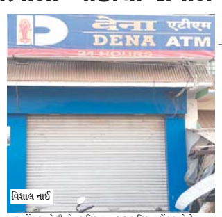
વિશાલ નાઈ અનુસંધાન પાના નં.૬

પ્રતિનિધિ અમીરગઢ અમીરગઢ તાલુકાનું વડુ મથક છે અને તાલુકાના વડુ મથક અમીરગઢ ખાતે આજુબાજુના ગામ લોકો અહીંના કોઈના કામ અર્થે આવુ પડે છે અને માલ-સામાન ખરીદી તથા દવાખાને સારવાર અર્થે આવતાં રહે છે અને તે માટે રૂપિયાની જરૂરીયાતો પડતી હોય છે અને લોકો પોતાના રૂપિયા સારવાર માટે પડી કે ચોરાઈ કે ખોવાઈ ના જ્ય માટે બેંકમાં જમા કરાવતા હોય છે અને જરૂરીયાત પડે એ. ટી. એમ. દ્વારા તેનો ઉપયોગ કરે છે. અમીરગઢમાં