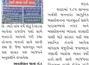
અનુસંધાન પાના નં.૬

પાલનપુરમાં દરેકરે શાસક પક્ષ વિરોધમાં પોસ્ટર લાખવા પ્રતિનિધિ પાલનપુર વિધાનસભાની ચૂંટણીના ઉદ્ઘાટન વાગવાની તૈયારીમાં છે. ત્યારે રાજકીય પક્ષના ભુખાને સમક્ષ બનાવે છે. જોકે, ચૂંટણી પૂર્વે જ પાલનપુરમાં અનેક જગ્યાએ શાસક પક્ષ ભાજપ વિરોધી પોસ્ટર લાખવા ચક્રવર્તી મચી જવા પામી છે. વિધાનસભાની ચૂંટણીને લઈને રાજકીય પક્ષો પોતાના આયુક્ત સચિવવામાં લાવી ગયા