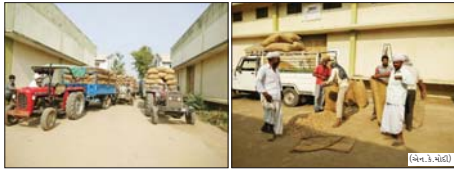
મગફળીની ખેતી (તા.પ્રતિ.)

જયારે ટેકાના ભાવે મગફળી ખરીદતા ખેડૂતોમાં ખુશીની લહેર (તા.પ્રતિ.) ધાનેરા બનાસકાંઠા જિલ્લા ખેતી અને પશુપાલન પર નિર્ભર જિલ્લો છે. જિલ્લાનો વેપાર ખેતી પર આધારિત છે. જો જમતનો તાત ખુશ તો સમગ્ર જિલ્લા ખુશ. જ્યારે આ વખતે જિલ્લાના કેટલાક તાલુકામાં પુર હોનાર તથા વ્યાક નુકસાન થયું હતું. સાથે ખેત તેમજ ઉમેલા પાકનો પણ ના પારેલું નુકસાન થયું હતું. જો કે સરકારે ની રહેમ નજર જિલ્લા પર રહેતા જિલ્લા માં ફેરી લોકો પણ ભર થઈ જીવન ધોરણ સામાન્ય બન્યું છે. વાત કરવામાં આવે તો ખેતીને જ્યારે આ ચોમાસુ સિંચાણમાં મુખ્યત્વે મગફળી મગફળીનું વાવેતર મોટા પ્રમાણમાં કરતા હોય છે. આજ થી ૧ વર્ષ પહેલાં ની વાત કરવામાં આવે તો તાલુકા મધ્યક ધાનેરા ખાતે મગફળીના વાવેતરમાં કોઈ સમજૂતી પણ ન હતું પણ સરકારની ખેડૂતલ્લી માલિતીથી આજનો ખેડૂત આધુનિક ખેતી તરફ વળ્યો છે. જેથી હવે ધાનેરા તાલુકા નું વાવેતર થવા લાગ્યું છે. આ વખતે સરકાર દવારા ટેકાના ભાવે મગફળી ખરીદવાનું નક્કી કરતા હાલ ધાનેરા સમાવેશના નજીક ટ્રેડરેટરોની મોટી લાઈનો જોવા મળે છે. જ્યારે ખેડૂતોની હાજરીમાં મગફળીની તોળાઈ તેમજ માલની ગુણવત્તા ની ખરાઈ કરતા ખેડૂતો પણ સહકારક ની આ કમળોત્તીથી ખુશ જણાઈ રહ્યા છે. ધાનેરામાં ત્રણ અલગ અલગ જગ્યાએ ટેકાના ભાવે મગફળી ખરીદવામાં આવી રહી છે. જો અત્યાર સુધી આવકની વાત કરવામાં આવે તો ધાનેરા ખરીદ વેચાલ સંઘમાં આવેર સુધી અંદાજિત ૩૫૦૦૦૦ બોરીની ટેકાના ભાવે ખરીદી કરાઈ છે. જ્યારે ધાનેરાના નેનાલા ગામે આવેલ બનાસ માર્કેટ યાર્ડ માં પણ અત્યાર સુધી ૪૨ થી ૫૦ હજાર જેટલી