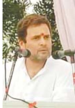
પુષ્પામૃતાલ રહેલી કેન્દ્ર સરકાર ઉપર પ્રહાર કર્યા હતા. રાહુલે મેક ઇન ઇન્ડિયા ઉપર પણ પ્રહાર કર્યા હતા અને કહ્યું હતું કે, આનાથી દેશના યુવાનોને વધારે રોજગાર મળી રહ્યા નથી. વિજય માલ્યા જેવા કોર્પોરેટ વિદેશમાં મોજ કરે છે અને અહીં ખેડૂતો, મજૂરો,

અમદાવાદ વિધાનસભા ચૂંટણીને લઈ દક્ષિણ ગુજરાતના પોતાના ત્રીજા તબક્કાના ચૂંટણી પ્રવાસે આવેલા કોંગ્રેસના રાષ્ટ્રીય ઉપાયથક રાહુલ ગાંધીએ આજે જાંજીર સહિતના સ્થળોએ યોજાઈ જાહેરસભામાં ફરી એકવાર મોદી સરકાર અને ભાજપ પર આકરા પ્રહારો કરતાં જણાવ્યું હતું કે, નોંધપાત્ર અને જીએસટીએ લોકોને બરબાદ કરી માંચ્યા છે અને સમગ્ર દેશની અર્થવ્યવસ્થા નષ્ટ કરી નાંખી છે. રાહુલે કહ્યું હતું કે, નરેન્દ્ર મોદીની સેક્ટરીથી ચીનમાં લોકોને રોજગારી મળી રહી છે. રાહુલે વર્લ્ડ બેંકની રિપોર્ટમાં ભારતની સિંથિતામાં આવેલા ઉછાળા પર