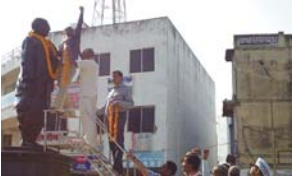
ચાણસ્મા કોંગ્રેસ સમિતિ દ્વારા સરદાર પટેલની જન્મજયંતિ નિમિત્તે તેમની પ્રતીમાને કુલશાર અર્પણ કર્યા હતા.