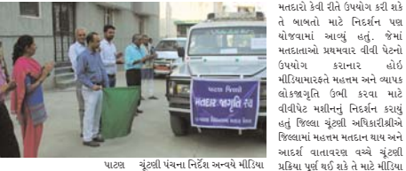
પાટણ વિધાનસભાની સામાન્ય મુંદ્રી-૨૦૧૬ના ઉપલક્ષમાં પાટણ જિલ્લામાં ચાર વિધાનસભા મંદિર વિભાગોમાં યોજનાર યૂંટણી માટે જિલ્લા માહિતી કચેરી-પાટણ ખાતે મીડિયા સેન્ટર અને એમ.સી. એમ.સી. સેન્ટરનું જિલ્લા યૂંટણી અધિકારીઓ આનંદ પહેલે ઉદઘાટન કર્યું હતું.

વિધાનસભાની સામાન્ય મુંદ્રી-૨૦૧૬ના ઉપલક્ષમાં પાટણ જિલ્લામાં ચાર વિધાનસભા મંદિર વિભાગોમાં યોજનાર યૂંટણી માટે જિલ્લા માહિતી કચેરી-પાટણ ખાતે મીડિયા સેન્ટર અને એમ.સી. એમ.સી. સેન્ટરનું જિલ્લા યૂંટણી અધિકારીઓ આનંદ પહેલે ઉદઘાટન કર્યું હતું. વિધાનસભાની યૂંટણીદરમિયાન જિલ્લાના મીડિયાના પ્રતિનિધિઓ રોજગરોજની યૂંટણીલક્ષી વિગતો નિયમિત રીતે ઉપલબ્ધકરવા માટે