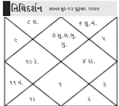
વિક્રમ સંત - ૨૦૦૪, શા.શિકે-૧૦૩૦૨, નામ સંતકલ્પ સંગ્રહમાં નામ વીર જીન સંત રવજી કારતક સુદ તેરાસ સુવરત્ત નભાઈનર બાદક સયાઈ ૬.૪૫ પછી રાજીની યોગ : હાંબકેશ ગર નામજી જન્મભાગની સવાની મનો (૬.૫.૩.૫.) અલશે ઉપર પાડવું સાચાક છે.