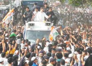
તેમના પ્રવચનમાં બેરોજગારી, શિક્ષણ, આરોગ્ય સહિતના મુદ્દાઓને લઈને પણ મોદી અને ભાજપ સરકાર પર ચાબખા વરસાવતાં જણાવ્યું હતું કે, મોદીએ યુવાનોને રોજગારી આપવાની મોટી મોટી વાતો કરી હતી, આપણી સીપી સ્વર્ણ ચીન સાથે છે. રાહુલ ગાંધીએ