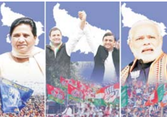
મોહમ્મદાબાદ ગોહના સીટ પરથી સાત ઉમેદવાર ભાગ્ય અજમાવી રહ્યા છે. સપાના સ્વાયમ મુલાયમ સિંહ યાદવના સંસદીય ક્ષેત્ર અજયગઢમાં વિધાનસભાની ૧૦ સીટ છે. વર્ષ ૨૦૧૨માં યોજાયેલી છેલ્લી ચૂંટણીમાં આમાંથી સમાજવાદી પાર્ટીએ નવ બેઠકો

બાબની ઉત્તરપ્રદેશ વિધાનસભાની ચૂંટણીના છટ્ટા તબક્કાના મતદાન માટેનો તારખે તૈયાર થઈ ગયો છે. છટ્ટા તબક્કામાં સાત જિલ્લાની ૪૯ બેઠકો માટે મતદાન યોજનાર છે. ગુરૂવારના દિવસે સાંજે ચૂંટણી પ્રચારનો અંત આવી ગયા બાદ હવે ઉમેદવારો ધરે ધરે જઈને પ્રચાર કરી રહ્યા છે. છટ્ટા તબક્કામાં સમાજવાદી પાર્ટીના સ્વાયમ મુલાયમસિંહ યાદવના લોકસભા ક્ષેત્ર અજયગઢમાં સંઘિત પુર્વવિધવા સાત જિલ્લાની ૪૯ બેઠકો માટે પ્રચારનો અંત આવ્યા બાદ હવે ઉત્સુકતા વધી ગઈ છે. છટ્ટા તબક્કામાં સૌથી વધારે ઉમેદવાર ગોરખપુર સીટ પર છે. આ સીટ પર કુલ ૨૩ ઉમેદવારો ભાગ લઈ રહ્યા છે. જ્યારે સાત ઉમેદવાર મઈ જિલ્લાની