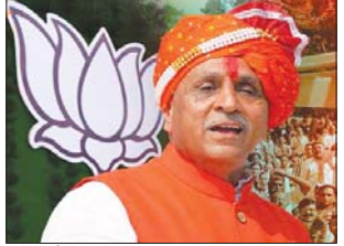
અને કાર્યકરો લાગેલા હતા. ગુજરાતના મુખ્યપ્રધાન તરીકે વિજય રૂપાણી ફરી એકવાર રાજ્યના મુખ્યપ્રધાન બનવા જઈ રહ્યા છે, જ્યારે નાથન મુખ્યપ્રધાન તરીકે પણ નિતિન અનુસંધાન પાના નં.૬

ગાંધીનગર ગુજરાતમાં વિધાનસભા ચૂંટણીમાં રેકોર્ડ સતત છઠ્ઠી વખત જીત હાંસલ કર્યા બાદ હવે આવતીકાલે વિજય રૂપાણી સરકારના શપથવિધીને લઈને તમામ તૈયારી પૂર્ણ કરી લેવામાં આવી છે. આવતીકાલે સવારે ૧૧ વાગ્યે ગાંધીનગરના નવા સચિવાલય ગ્રાઉન્ટ ખાતે શપથવિધી યોજનાર છે. જેની તૈયારી છેલ્લા કેટલાક દિવસથી ચાલી રહી હતી. શપથવિધીને ભવ્ય અને શાનદાર બનાવવા માટે ભાજપના ટોપના નેતાઓ