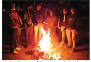
અમદાવાદ સહિત રાજ્યભરમાં એકાએક ઠંડીનું મોજુ ફટકો વધ્યું છે. હાલમાં ઠંડા પવન ફૂંકાઈ રહ્યા છે. છેલ્લા બે દિવસમાં તાપમાન નીચે પહોંચી ગયું છે. આજે પણ અમદાવાદમાં લઘુત્તમ તાપમાન ૧૧.૨ ડિગ્રી રહ્યું હતું. બીજા ભાગુ પાટનગર ગાંધીનગરમાં લઘુત્તમ તાપમાન ૯.૮ ડિગ્રી સુમસામ બની રહ્યા છે. રહ્યું હતું. એકાએક ઠંડીમાં રાજ્યમાં નલિયા સૌથી વધારે વધારો થતા રતા મોડી સાંજે જ અનુસંધાન પાના નં.૬

ગુજરાતના જુદા જુદા ભાગોમાં એકાએક ઠંડીમાં વધારો