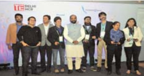
પાવર ૨ એસએમઈ એજે નવી દિલ્હીમાં ટાઈકોન

૨૦૧૭ના વર્ષમાં સીબીઆઈની સાથે-સાથે ટાઈ દિલ્હી એનારાઈટીના સરવત્રમાં સિલ ઓફ મેન્યુફેક્ચરિંગ એવોર્ડ્સની સીઝન-૪ને સમાપ્ત કરી. શ્રી હંસરાજ આકિરગુજ રાજ્ય મંત્રી, ત્યાર સરકાર) મુખ્ય મહેમાનના રૂપમાં મારમોરોએ જાહેર હાથ અને એમણે ભારતની વિકાસ યાત્રામાં યોગદાન આપ્યા વિના સંયુક્ત એસએમઈની ભૂમિકા પર એમના વિચાર રજૂ કર્યાં.આ સંયુક્ત પહલ (સિલ ઓફ મેન્યુફેક્ચરિંગ) વિનિર્માણ લોગોમાં સીબીઆઈને સાહકૃતિક વ્યવસ્થાશિકોને સન્માનિત કરવા માટે સમર્પિત છીએ એને વિનિર્માણ લેસના મહત્વ અને આ લેસમાં નવાચારની ભૂમિકાને સ્પષ્ટિત કરવા માટે ડિઝાઇન કરવામાં આવી છે.