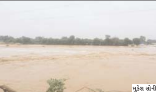
મુશ્કેલીમાં ગણતા બનાસકાંઠા જિલ્લામાં ભયાનકભાવે વરસાદ અને પુર પ્રકોપમાં જન માલ અને ખેતરો તબાહ થયા. અહીં કુદરતના ક્રોર એવો તો વરસો છે નુકસાનીનું બિહામણું ચિત્ર હવે સ્તરી રહ્યો છે. લોકોના આરોગ્યને જાળવવા માટે એન્ટી મેલેરીયલ એક્ટીવીટી વ્યાપક રીતે કરવામાં આવી રહી છે. ૨૭૪, ૭૬૬૨૦ ખેડૂતો અને ૭૨૦ હેક્ટર વડે સારી સારી આરોગ્ય ટીમો લોકોને આરોગ્ય સુવિધાઓ પુરી પાડી રહ્યા છે. ૧૨૧ જેટલા જેસીબી મશીનો અને ૩ હીલ્ટીબી મશીનો અને સંખ્યાબંધ વીલ્ટેરીયલ ધેપ કાર્પન્ટ છે. થરાદ ખાતે ૩૧ વી.એમ.સી. ની ટીમો તથા ૧૮ હેલ્થની ટીમો કાર્પન્ટ છે.

જમીનોનું ઘોલાણ ઘાંટા ખેડૂતો મુશ્કેલીમાં ગણતા બનાસકાંઠા જિલ્લામાં ભયાનકભાવે વરસાદ અને પુર પ્રકોપમાં જન માલ અને ખેતરો તબાહ થયા. અહીં કુદરતના ક્રોર એવો તો વરસો છે નુકસાનીનું બિહામણું ચિત્ર હવે સ્તરી રહ્યો છે. લોકોના આરોગ્યને જાળવવા માટે એન્ટી મેલેરીયલ એક્ટીવીટી વ્યાપક રીતે કરવામાં આવી રહી છે. ૨૭૪, ૭૬૬૨૦ ખેડૂતો અને ૭૨૦ હેક્ટર વડે સારી સારી આરોગ્ય ટીમો લોકોને આરોગ્ય સુવિધાઓ પુરી પાડી રહ્યા છે. ૧૨૧ જેટલા જેસીબી મશીનો અને ૩ હીલ્ટીબી મશીનો અને સંખ્યાબંધ વીલ્ટેરીયલ ધેપ કાર્પન્ટ છે. થરાદ ખાતે ૩૧ વી.એમ.સી. ની ટીમો તથા ૧૮ હેલ્થની ટીમો કાર્પન્ટ છે.