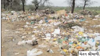
વેતન શ્રીમાળી રાતના સુમારે ગંદકી પણ ઠલવાય છે. જે કચરો બિનઅધિકૃત રીતે સુખાવાય છે. જેના કારણે જેની કમ્પાઈની હવામાં ભળે છે. આટલું ઓછું હોય તેમ હાલમાં ચોમાસુ સિઝનમાં નગરપાલિકાના વાહનો લાખરના બદલે ઘાઈવે રોડ ઉપર જ કચરો ઠાલવે છે. જેના કારણે ગંદકીનો સામ્રાજ્ય છવાયું છે.

ગંદકીના સામ્રાજ્યથી ગંદકીના સામ્રાજ્યમાં ઘાઈવે ઉપર આંચેલ પાટણ ઘાઈવે ઉપર આંચેલ જુનાડીના ગામના બ્લોગમાં થન કચરાનો નિકાલ થયો છે. પરંતુ પાલિકાના કમ્પાઈનીઓ દ્વારા કચરો ઘાઈવે રોડ ઉપર જ ઠલવાતા ગંદકીના સામ્રાજ્ય સાથે ભયંકર દુર્ગંધથી લોકોને પહાર થતું પણ મુશ્કેલ થઈ પડ્યું છે. ગામના સુમારે ગંદકી પણ ઠલવાય છે. જે કચરો બિનઅધિકૃત રીતે સુખાવાય છે. જેના કારણે જેની કમ્પાઈની હવામાં ભળે છે. આટલું ઓછું હોય તેમ હાલમાં ચોમાસુ સિઝનમાં નગરપાલિકાના વાહનો લાખરના બદલે ઘાઈવે રોડ ઉપર જ કચરો ઠાલવે છે. જેના કારણે ગંદકીનો સામ્રાજ્ય છવાયું છે.