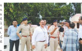
મુખ્યમંત્રી આજે કાંકરેજ તાલુકાના ખાસ મંત્રી વિજયભાઈ રૂપાણીએ મુલાકાત લઈ સ્થિતિની સર્વગ્રાહી

તા.પ્રતિનિધિ ધાનેરા બનાસકાંઠા જિલ્લાના ધાનેરામાં પુરગ્રસ્તોના પગલે ટૂંક ગાળામાં રાજ્યના મુખ્યમંત્રી વિજયભાઈ રૂપાણી આજે રવિવારે ત્રીજી વખત મુલાકાતે આવી રહ્યાં છે. તેથી તંત્ર ખડેપગે થઈ ગયું છે. મુખ્યમંત્રીના આગમનને લઈ નગરમાં પોલીસ કાફલો ખડકી દેવાયો છે.