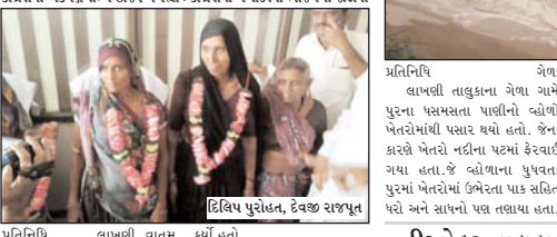
લાખણી તાલુકા પંચાયતના પ્રમુખ અને ઉપપ્રમુખની ચૂંટણી ૨૮ જુલાઈ અને યોજાઈની જાહેરાત તંત્ર દ્વારા કરવામાં આવી હતી. વોટથી ભાજપના ઉમેદવાર પ્રમુખ તરીકે વિજેતા થયા હતા. જ્યારે ઉપપ્રમુખ તરીકે ભાજપના ઉમેદવાર બિનરહીસ જાહેર થયા હતા. ચૂંટણી બાદ કોંગ્રેસના બે સદસ્યોએ રાજ્ય મંત્રી કેશવજી ચૌહાણના હાથે ભગવો ખેસ ધારણ કર્યો હતો.

ગ્રેંસેના એકપક્ષ સભ્ય હાજર ન રહ્યા : ગ્રેંસેના બે સદસ્યો ભાજપમાં જોડાયા લાખણી તાલુકાના તાલુકા પંચાયતના પ્રમુખ - ઉપપ્રમુખની ચૂંટણી નાટ્યાત્મક વર્ણાંક બાદ શનિવારે યોજઈ હતી. જેના ૮-૦ વોટથી ભાજપના ઉમેદવાર પ્રમુખ તરીકે વિજેતા થયા હતા. જ્યારે ઉપપ્રમુખ તરીકે ભાજપના ઉમેદવાર બિનરહીસ જાહેર થયા હતા. ચૂંટણી બાદ કોંગ્રેસના બે સદસ્યોએ રાજ્ય મંત્રી કેશવજી ચૌહાણના હાથે ભગવો ખેસ ધારણ કર્યો હતો.