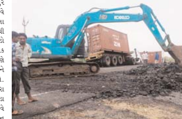
તાત્કાલિક કપચી મંચાવીને ટ્રિબીકી અને નાના ફોર લીલર માટે છાઈવે ચાલુ કરી દેવામાં આવ્યો છે.

સલામત રીતે નીચે ઉતાર્યાં છે. તેમણે કહ્યું કે ત્રણ દિવસ રાત સુધી ભૂખ્યા તરસ્યા ઘાબા ઉપર રહ્યાં ગામની ટુકડાઓ જે માલ તણાઈને બહાર આવ્યો હતો તે ખાવાનો વારો આવ્યો હતો લોકોના જીવ્યાઆ અનુસાર માત્ર બિલ્કિનેના હોઈ આથી એક એક વ્યક્તિને માત્ર બેથી ત્રણ જેટલા બિલ્કિને જ ભાગમાં આવ્યા હતાં અને હજુ કોઈ સહાય મળી નથી