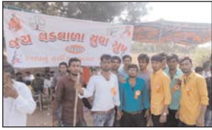
ડીસા તાલુકા વિરુણા ગામ જાય વડવાળા યુવા ગ્રુપ દ્વારા કારતક સુદ પુનમનો લાખણસર શ્રી હંતુમાના મંદિરમાં મેળો ભરાઈ છે તે આ મેળામાં વિરુણા ભસ સ્ટેન્ડન ડ્રિપર કેમ્પ રાખવામાં આવ્યો હતો જે વ્યક્તિ લાખણસર મેળા જોઈ તેને ચા પાણીની કેમ્પનું આયોજન કરેલ છે. આ પાણી લાખણશ્રી શ્રી દેવ પુરીભાઈની કૃપાથી ચા પાણી અને ભક્તોની સેવા કરી હતી.