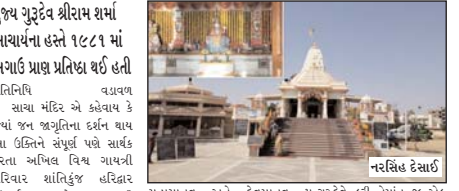
પુણ્ય ગુરુદેવ શ્રીરામ શર્મા આચાર્યના હસ્તે ૧૯૮૧ માં અર્ચાઈ પ્રણામ કરાયા હોઈ હતી પ્રતિનિધિ વચ્ચળ સાચા મંદિર એ કહેવાય કે જ્યાં જન જાગૃતિના દર્શન થાય આ ઉત્તિને સંપૂર્ણ પહે સાર્થક કરતા અખિલ વિષય ગામની પરિવાર શાંતિજીજ હરિદાર અંતર્ગત અનેક ગામની શક્તિપીઠની સ્થાપના ગામની પરિવારના આદર્યાપક પુ.ગુરુદેવ પ.શ્રીરામ શર્મા આચાર્યજીએ કરી હતી. પુણ્ય ગુરુદેવના મતે મંદિરો ફક્ત પૂજાપાઠ કે કમ્પંકડ સુધી સીમીત ન રહેવા જોઈએ. પરંતુ સમાજમાં સ્વચાલક, સુધારામ્ક પ્રવૃત્તિઓના સકારાત્મક કાર્યક્રમો કેન્દ્ર હોવા જોઈએ. જે માનવીને જીવન જીવવાનું માર્ગદર્શન આપીને માનવને મહામાનવ અને દેવમાનવ શક્તિપીઠ એટલે ડીસા ગાયત્રી ભારતભરમાં આર્ચાઈ પ્રણામ કરવામાં આવી છે. જ્યાં સામાના, શિક્ષક, આચાર્યજીએ આજથી ૩૬ વર્ષ અર્ચાઈ કરવામાં આવી છે. જ્યાં ૧૯૮૧ ની તારીખ પૂર્ણિમાના દિવસે તેઓના જાગૃત્વ, કુરીવાજ ઉમુલ્લવ વગેરેના સંદર્ભ અને કાર્યક્રમો મુજબ છે. ભારતભરમાં પ્રથમ ૨૪ ગાયત્રી શક્તિપીઠના અનુસંધાન પાના નં.૬