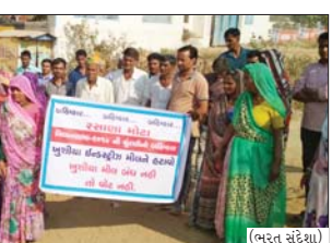
જાહેરમાં છોડાતાં આજુબાજુ રહેતા લોકો પારાવર પરંપત્રની ભોગવી રહયા છે. તેના વિરુદ્ધમાં રસાણા ગ્રામજનોએ અગાઉ પણ મોટી રેલી નીકળી નાયબ ક્લેક્ટર, ડીસા અને જિલ્લા ક્લેક્ટર, બનાસકાંઠા ને લેખિતમાં આવેલ પત્ર આપવામાં આવ્યું હતું. પરંતુ આજ દિનુસુધી કોઈ કાર્યવાહી ન થતા લોકો સરકાર પ્રત્યે નારાજગી વ્યક્ત કરી રહ્યા છે. ગ્રામજનોના જાણ્યા અનુસાર રસાણા ગ્રામજનોએ વર્ષ ૨૦૧૪ થી આ લણત આપી રહ્યા છે જેની જાણ મુખ્યમંત્રી સુધી કરવામાં આવી છે. આ મિલના સંચાલકો દ્વારા મિલ મંથી નીકળતું કેમિકલ યુક્ત પાણી રોડ પર ઠાલવામાં આવી રહ્યું છે. જેના કારણે આજુબાજુના ખેતીની જમીનને મોટું નુકસાન થઈ રહ્યું છે. તેમજ મિલમાંથી નીકળતા ઘોઘા થી બાળકોને ભણવામાં પણ મુશ્કેલીઓ ભોગવવી પડે છે જેથી બાળકોનું ભવિષ્ય પણ જોખમી રહ્યું છે. ગામ લોકોને ખાત્રી, કક અને ચામડીના રોગ જેવી બીમારીઓ થી પીડાઈ રહ્યા છે છતાં તેનું પેટનું પાણી હલતું નથી. તેથી આ બાબતે લોકો એકઠા થઈ મતદાનનો બાહિષ્કાર કરવાનો નિર્ણય કર્યો છે. જો આ સમસ્યાનો હલ કરવામાં નહીં આવે તો ગ્રામલોકોએ આવિસ્તારના ૧૫૦૦ થી વધુ વોટ પરવાતા લોકો ચુંટણીમાં મતદાન નહિ કરવાનો નિર્ણય લીધો છે અને તે અંગે આ બંનેરો લગાવ્યા છે.