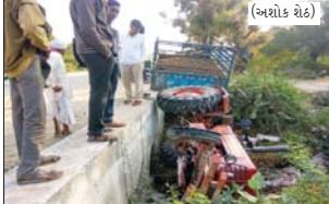
તાલુકા પ્રતિનિધિ દીઓદર ટીઓદર તાલુકાના સુરાણા ગામે ભસ સ્ટેન્ડથી આગળ રેથા તરફ જવાના ચાર રસ્તા પાસે તા.૩૦-૧૧-૨૦૧૭ના રોજ રાત્રીના ૨ વાગ્યાના સુમારે શિલોરી તરફથી દીઓદર તરફ આવી રહેલ ટ્રોલી સાથેનું મહીન્દ્રા ટી.ઓઈ ડ્રાઇવરને ગંભીર ઉજાઓ થવા પામેલ હોવાનું જાણવા માનવા માટે બનાવેલા

જાહેરમાં છોડાતાં આજુબાજુ રહેતા લોકો પારાવાર પરેશની ભોગવી રહ્યા છે. તેના વિરુદ્ધમાં રસાણા ગ્રામજનોએ અગાઉ પણ મોટી રેલી નીકળી નાયબ ક્લેક્ટર, ડીસા અને જિલ્લા ક્લેક્ટર, બનાસકાંઠા ને લેખિતમાં આવેદનપત્ર આપવામાં આવ્યું હતું. પરંતુ આજ દિનસુધી કોઈ કાર્યવાહી ન થતા લોકો સરકાર પ્રત્યે નારાજગી વ્યક્ત કરી રહ્યા છે. ગ્રામજનોના જાણ્યા અનુસાર રસાણા ગ્રામજનોએ વર્ષ ૨૦૧૪ થી આ લડત આપી રહ્યા છે જેની જાણ સમગ્રમંત્રી સુધી કરવામાં આવી છે. આ મિલના સંચાલકો દ્વારા મિલ માંથી નીકળતું કેમિકલ યુક્ત પાણી રોડ પર ઠાલવામાં આવી રહ્યું છે. જેના કારણે આજુબાજુના ખેતીની જમીનને મોટું નુકસાન થઈ રહ્યું છે. તેમજ મિલમાંથી નીકળતો ઘોંઘાટથી બાળકોને ભણવામાં પણ મુશ્કેલીઓ ભોગવવી પડે છે જેથી બાળકોનું ભવિષ્ય પણ જોખમી રહ્યું છે. ગામ લોકોને ખાત્રી, ક્ક અને ચામડીના રોજ જેથી બીમારીઓ થી પીડાઈ રહ્યા છે છતાં તેનું પેટનું પાણી હલતું નથી. તેથી આ બાબતે લોકો એકઠા થઈ મતદાનનો બાહિષ્કાર કરવાનો નિર્ણય કર્યો છે. જો આ સમસ્યાનો હલ કરવામાં નહીં આવે તો સમગ્રલોકોએ આવિસ્તારના ૧૫૦૦ થી વધુ વોટ પરવાતા લોકો યુટીલીમાં મતદાન નહિ કરવાનો નિર્ણય લીધો છે અને તે અંગે આ બંનેરો લગાવ્યા છે.