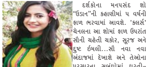
દર્શકોના મનપસંદ શો “ઉડાન”ની કલાકાની પ વર્ષની “ફામ ભરવામાં આવશે. પ વર્ષની એલના આ શોમાં ફામ ઉંચાઈ સૌની ચહેતા ઈશ્વર, સૂરજ અને ઈશ્વર પછી... તો નવા નવા અંદાજમાં દેખાશે અને તેણેના પરસ્પરના સંબંધમાં ઘટતી-આસમાન જેવું અંતર આવશે. આપના મામ આજાદગંજની પુ હાલત છે, ચક્રોરને કેવી સ્થિતિમાંથી પસાર ચુવું પડશે... આવો પૂછીએ છે ચક્રોર એટલે કે મીરા દેવસ્થાલેપાસેથી

૧. ફામ ઉંચાઈ ચક્રોરમાં શું પવિત્રતા આવશે? - ફામ ભરતાં અગાઉ ચક્રોર જેવામાં ચાલી ગઈ હતી. જ્યારે તે પ વર્ષ પછી પાછી ફરે છે તો તેને લાગે છે કે ફામ નાશવાનુ માટે પછી આજાદગંજ ગુલાબી અને દાસ-પ્રમણીઓ શી આજાદ માઈ જશે. પણ ક્યા કરવા પર તે જુએ છે કે આજાદગંજની સ્થિતિ તો વધુ ખરાબ થઈ ગયેલ છે. એમાં એની કદર દુઃખન ઈશ્વરની કળો છે. સૌથી મોટા આંકડાની વાત તો એ છે કે જે સૂરજને તે પોતાનો સમજતી હતી. તેની નીતિ લાલાત હતી. તે તેથીને ઓળખવા ચુકાંથી કદાર કરી દે છે. તે ભલેની ગુલાબ બની ગયેલ છે. ઈમલીના ઈ પારા પર તે ગામવાલોને પર અલ્યાવા કરે છે. આનાથી ચક્રો પૂર્ણપણે ભાંગી પડે છે. પરંતુ ઠીક સમયમાં જ તેથી પોતાને એક નવી લડત માટે તૈયાર કરી લે.