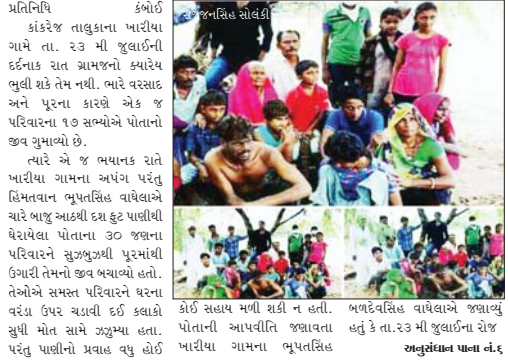
અનુસંધાન પાલ નં.૬

કલાકો સુધી મોત સામે ઝગમગા પહા પાણીનો પ્રવાહ લોઈ કોઈ સહાય ન મળી