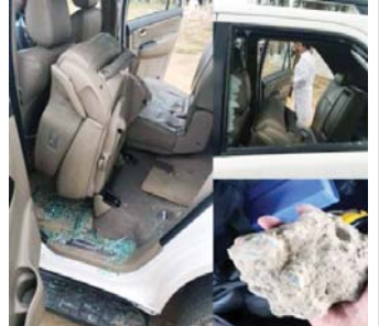
લુબેટ પુફગાડી આપી હતી પરંતુ તેમને ઈન્કાર કર્યો હતો : એસ.પી

ધાનેરાની પુરઅસરગ્રસ્ત વિસ્તારોમાં મુલાકાત લઈ જાહેરસભા સંબોધી અને સભા સ્થળેથી ૨૦૦ મીટરના સ્થળે પહોંચ્યા હશે ત્યાં કોઈ અજાણ્યા ઈસમે રાહુલ ગાંધીને લઈ જતી ગાડી પર પથ્થર માર્યો હતો જોકે તેમા ભાજપના ૧૦ જેટલા કાર્યકરોએ કાળા ઝંડા બતાવી ઉગ્ર વિરોધ કર્યો હતો. જેના કારણે રાહુલ ગાંધીએ પ્રવચન આપતા ચોરી મોનોટો માટે રોકાઈ જવું પડ્યું હતું. જોકે, ૧૦ જેટલા કાર્યકરોની પોલીસ દ્વારા અટકાયત કરવામાં આવી હતી. જેમાં ૨ થી ચાર કાર્યકરોને પોલીસ દ્વારા માર પણ મારવામાં આવ્યો હતો. ત્યારે રાહુલ ગાંધી અને માત્ર ૧૦ મીનીટમાં સભા પતાવી હેલીપેડ જવા રવાના થયા હતા. ત્યાંજ ૨૦૦ મીટરના અંતરે રાહુલ ગાંધીની ગાડી પર કોઈ અજાણ્યા ઈસમે દેશભરમાં ચક્રાર મચી ગઈ હતી.