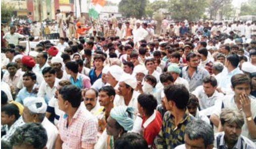
અવ્યો હતા. જેને લઈ ચક્રાર મચી જવા પામી હતી.

અસરગ્રસ્ત વિસ્તારોની મુલાકાત લીધી હતી જેમા ધાનેરા હેલીપેડ ઉત્તરાણ કાર્યા બાદ માલોરા ગામમાં પુરના પાણીમાં મૃત્યુ પામેલા પ્રજાપતિ પરિવારને મળ્યા હતા અને ત્યારબાદ રાજપુત વાસમાં પણ પુરના કારણે મૃત્યુ પામેલા લોકોના