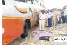
સામે ખુલ્લા પ્લોટમાં પાર્ક કરી હતી. ડ્રાઈવરે લક્ઝરી બસ પાર્ક કર્યા બાદ કંકડટર યુગ્મને લક્ઝરી બસની સફાઈ કરી રહ્યો હતો તે દરમિયાન જે સ્થળે બસ પાર્ક કરી તેની ઉપર થી ૧૧ હજાર કેવીની હેવી વીજ વાયરનું પસાર પાલનપુર હાઈવે પર ભોયણ ગામના પાટીયા થતી હતી.

ડીસા ડીસા-પાલનપુર હાઈવે પર ભોયણ નજીક ખુલ્લા વોટમાં લક્ઝરી બસ પાર્ક કરી કંકડટર સફાઈ કરતો હતો ત્યારે લક્ઝરી બસને ઉપરથી પસાર થતી હેવી વીજ વાયર અડી જતા સફાઈ કરતાં કંકડટરનું વીજકેટ લાગવાથી સ્થળ પર મોત નીપજ્યું હતું. આ અંગેની વિગત એવી છે કે ડીસા થી સુરત નવસારી ની રેઈલ્વે સર્વિસ કરતી માન ટ્રાવેલ્સની લક્ઝરી બસ નંબર જી.જે. ૩ એ.૭૫૫ ૮૮૭૮ સોમવારે સવારે ટ્રીપ પરથી આયા બાદ ડીસા-પાલનપુર હાઈવે પર ભોયણ ગામના પાટીયા સામે ખુલ્લા પ્લોટમાં પાર્ક કરી હતી. ડ્રાઈવરે લક્ઝરી બસ પાર્ક કર્યા બાદ કંકડટર યુગ્મને લક્ઝરી બસની સફાઈ કરી રહ્યો હતો તે દરમિયાન જે સ્થળે બસ પાર્ક કરી તેની ઉપર થી ૧૧ હજાર કેવીની હેવી વીજ વાયરનું પસાર પાલનપુર હાઈવે પર ભોયણ ગામના પાટીયા થતી હતી.