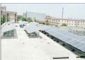
અસર પણ પ્લાન્ટે સ્થાપવામાં આવેલ છે જેમાં ફરીદાબાદ, કાનપુર અને લખનૌ પ્લાન્ટ ખાતે પણ ટૂંક સમયમાં સોલાર આધારિત વીજળી ઉત્પાદન કરવા માટેના યુનિટો કાર્યરત કરવામાં આવ્યા છે.

પાલનપુર બનાસ કેરી ખાતે સોલાર વુનિટો સ્થાપિત કરવામાં નિર્મિત સોલાર પેનલનો ઉપયોગ કરીને વડાપ્રધાનશ્રીના 'મેક ઓન ઇન્ડિયા'ના ઉદ્દેશ્યને આગવું પાળવા માટે સરકાર પ્રયત્ન કરી છે. તાજેતરમાં બનાસ કેરી, પાલનપુર ખાતે ૧૦૦૦ કિલો વોટ(૧૧૨) કેપિસિટી ધરાવતો સોલાર આધારિત વીજળી ઉત્પાદન પ્લાન્ટ કાર્યરત કરવામાં આવ્યો છે તેના લીધે પાલનપુર અને લખનૌ પ્લાન્ટ યથો. બનાસ કેરીના રાજ્ય