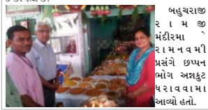
બહુચરાજી રામ મંદિરમાં પ્રસંગે છાપ્પન બંધ કરાવવામાં આવ્યો હતો.

બહુચરાજીમાં આવેલ સબ પોસ્ટ ઓફિસ અને લાટીની વચ્ચે બજારના ચોમાસુ પાણીના નિકાલ માટે ખુલ્લી જગ્યા આવેલી છે. અને આ જગ્યાનો ઉપયોગ બહુચરાજીના લોકો કચરો ઠાલવવા માટે કરે છે. પરિણામ અહીં ગંદકીનું સાચાજીવન જીવવા પુલ્લી જગ્યા આરસરે ૩ થી ૫ ફુટ ઉંચા ખાડાવાળી છે અને લોકો આ રસ્તા ઉપરથી આવન જાવન કરે છે. શંખલપુર ધામ જવા આ જગ્યા નજીકથી જ પાનગી વાહનો પેલેન્જરોની ઠેકરેટી કરે છે. ગંજ બજારનો જાવન મુખ્ય રસ્તા પછા આ છે. અહીંથી ચાણસ્મા, પાટા તરફ તમામ એસ.ટી. સેવા આ રસ્તેથી જ પસાર થાય છે. આ ખાડાવાળી જગ્યા ગમે ત્યારે રાહદારીઓ અને વાહનચાલકો માટે ગંભીર ખતરા સમાન છે. સ્થાનિક સામપ્રધાન આ ખુલ્લી જગ્યા ઉપર સ્વેલભમી ચોમાસામાં બજારના પાણીનો નિકાલ સ્વેલ ઉપર થઈ શકે તે માટે જરૂરી કાર્યવાહી કરવા કારવ લટી દીધેલ છે. તેમ છતાં હજુ સુધી કોઈ કાર્યવાહી હાથ ધરવામાં આવી નથી. પરિણામે કેટલાક અકસ્માતો પહોં પંચાયત ગંભીર અકસ્માત સર્જીને નાવો નથી. ત્યારે સ્થાનિક સામ પ્રધાન સત્વરે જરૂરી કાર્યવાહી કરે તેનું સ્થાનિક લોકો ઈચ્છી રહ્યા છે.