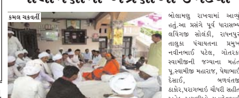
સાંતલપુર તાલુકાના ધોકાવાડામાં અગ્રણીઓ ઉમટ્યા