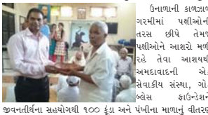
ઉનાળાની કાળખાળ ગરમીમાં પશીઓની તરસ છીપે તેમજ પશીઓને આશરો મળી રહે તેવા આશયથી અમદાવાદની એક સેવાકાય સંસ્થા, ગોડ બ્લેક ફાઉન્ડેશને જીવનતીર્થના સહયોગથી ૧૦૦ ફૂંગા અને પંખીના માથાનું વીતરણ કર્યું.