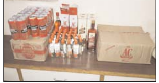
દાંતાના નાગેલ ગામે ઘાસના પુળા નીચે સંતાડેલો વિદેશી દારૂ ઝડપાયો