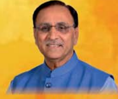
માનનીય શ્રી વિજય રૂપાણી મુખ્યમંત્રી, ગુજરાત રાજ્ય