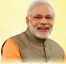
માનનીય શ્રી નરેન્દ્ર મોદી વડાપ્રધાન, ભારત સરકાર