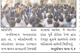
અનુસંધાન પાના નં.૬

દાંતા વનવિભાગ બનાસકાંઠા દ્વારા ત. ૨ ઓક્ટોબરની રોજ પંકુડેપ મુકોંગ પ્રાકૃતિક સંરક્ષણ મહિલાઓ સાથેની નિર્વિગ્ની