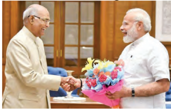
રામનાથ કોવિંદે મીરાકુમાર ઉપર લીડ મેળવી લીધી હતી. પ્રથમ રાઉન્ડમાં કોવિંદને ૬૦.૨૪૪ વોટ વેળું મળ્યા હતા જ્યારે મીરાકુમારના પાતામાં ૩૬.૭૩૧ વોટ વેળું ગયા હતા. પ્રથમ રાઉન્ડના આંકડા મુજબ એનડીએ ઉમેદવાર કોવિંદને ૬૫.૬૫ ટકા મત મળ્યા હતા જ્યારે મીરાકુમારની તરફેણમાં ૩૪.૩૫ ટકા મત મળ્યા હતા. રાષ્ટ્રપતિની ચૂંટણીમાં સૌથી વધારે (અનુસંધાન પેજ ૬ પર )

નવી દિલ્હી, તા. ૨૦ એનડીએના ઉમેદવાર રામનાથ કોવિંદે આજે રાષ્ટ્રપતિની ચૂંટણીમાં ધારણા પ્રમાણે જ જોરદાર સપાટો બોલાવ્યો હતો. કોવિંદે હવે ૨૫મી જુલાઈના દિવસે દેશના ૧૪માં રાષ્ટ્રપતિ તરીકે શપથ લેશે. કોવિંદે યુપીએના ઉમેદવાર મીરા કુમારને ૩૪.૩૫ ટકા મત મળ્યા હતા. રામનાથ કોવિંદને ૭૦.૨૪૪ની કિંમતના ૨૬.૮૦ મત મળ્યા હતા જ્યારે મીરાકુમારને ૩૬.૭૩૧ની કિંમતના ૧૮.૪૪ મત મળ્યા હતા. ૭૭ મત અમાન્ય જાહેર થયા હતા. રાષ્ટ્રપતિની ચૂંટણી માટના રિટર્નિંગ ઓફિસર દ્વારા આ મુજબની જાહેરાત કરાઈ હતી. ૧૭મી જુલાઈના દિવસે ભારે ઉત્સુકતા શરૂઆતથી દેખાઈ હતી. આખરે ધારણા પ્રમાણે જ કોવિંદે બાજુ મારી હતી. સવારે ૧૧ વાગે સંસદ ભવનમાં મતગણતરીની શરૂઆત થઈ હતી. નવા રાષ્ટ્રપતિ ચૂંટી કાઢવા માટે આશરે ૮૯ ટકા મતદાન થયું હતું. મતગણતરીમાં કોવિંદને ૬૫.૬૫ ટકા મત મળ્યા હતા. જ્યારે યુપીએના ઉમેદવાર મીરા કુમારને ૩૪.૩૫ ટકા મત મળ્યા હતા. રામનાથ કોવિંદને ૭૦.૨૪૪ની કિંમતના ૨૬.૮૦ મત મળ્યા હતા જ્યારે મીરાકુમારને ૩૬.૭૩૧ની કિંમતના ૧૮.૪૪ મત મળ્યા હતા. ૭૭ મત અમાન્ય જાહેર થયા હતા. રાષ્ટ્રપતિની ચૂંટણી માટના રિટર્નિંગ ઓફિસર દ્વારા આ મુજબની જાહેરાત કરાઈ હતી. ૧૭મી જુલાઈના દિવસે ભારે ઉત્સુકતા શરૂઆતથી દેખાઈ હતી. આખરે ધારણા પ્રમાણે જ