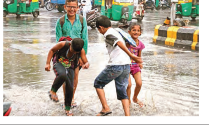
અમદાવાદ શહેરમાં આજે બપોરે બાદ ભારે ગાજવીજ સાથે શરૂ થયેલા વરસાદે શહેરના તમામ વિસ્તારોમાં જળબંબાકારની પરિસ્થિતિ સર્જી દીધી હતી. શહેરમાં બપોરે ચારના સુમારે શરૂ થયેલા અનરધાર વરસાદને પગલે અનેક વિસ્તારોમાં પાણી ફરી વળતા શહેરના મીઠાપણી અને અખબારનગર અંડરપાસ સહીતના તમામ અંડરપાસ બંધ કરવાની મ્યુનિસિપલ તંત્રને ફરજ પડવા પામી હતી. આંબાવાડીમાં વીજ કરંટ લાગતા બે મહિલાના મોત થવા પામ્યા છે. અમદાવાદ શહેરમાં બપોરે ચારથી સાત સુધીમાં સાડા ત્રણ ઈંચ જેટલો વરસાદ થવા પામતા અમદાવાદના અનેક વિસ્તારો બેટમાં ફેરવાઈ જવા પામ્યા હતા. આ અંગેની વિગત એવી છે કે, આજે દિવસ દરમિયાન