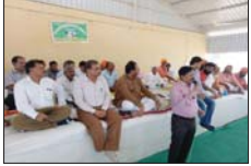
ટેલોગ ખાતે મળેલી ગૌશાળા અને પાંજરાપોળના કોલેક્ટર ડી.સા.ના ધ્યાનમાં રાજ્ય સરકારના અભિગમને ઠિરદાવ્યો