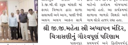
શ્રી ગૌરવપૂર્ણ પરિણામ

પાલનપુર પ્રથમવર્ષ અને દ્વિતીયવર્ષનું પરિણામ ૧૦૦ ટકા આવેલ છે 'વિમળા જ્યોત' સંચાલિત ક્ષી દિતીયવર્ષમાં કુલ ૬૦ માંથી ૫૪ ક્ષી.જી.મહેતા સ્ત્રી અધ્યાપન મંદિર, ચિત્રાસણીનું ઓરિલ-૨૦૧૮ માં લેવાયેલ પ્રાથમિક બહેનો પ્રથમવર્ષ સાથે શિશુલ ઈલોમાં પરીક્ષા