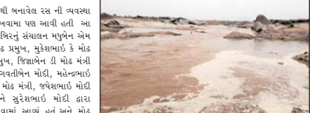
અમીરગઢ બનાસ નદીમાં નવાં નિરની આવક

અમીરગઢ બનાસ નદીમાં નવાં નિરની આવક અમીરગઢ બનાસ નદીમાં નવાં નિરની આવક અમીરગઢ બનાસ નદીમાં નવાં નિરની આવક અમીરગઢ બનાસ નદીમાં નવાં નિરની આવક અમીરગઢ બનાસ નદીમાં નવાં નિરની આવક