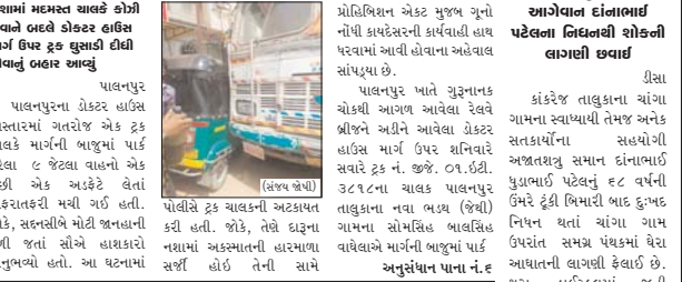
પાલનપુરના ટ્રેક્ટર લાઇસ વિલાસમાં ગતરોજ એક ટ્રક ચાલકે માર્ગની બાજુમાં એક ટ્રક જોટલા વાહનો એક પછી એક અડકે લેતાં અકસ્માતોની મચી ગઈ હતી. જોકે, સંસ્તરીબે મોટી જાણવાની ટળી જતાં સૌને હાજર કરી અનુબળ્યો હતો. આ ઘટનામાં ટ્રક ચાલકની અકસ્માત કરી હતી. જોકે, તેણે ઘટના નશામાં અકસ્માતની હારમાળા સર્જી હોઈ તેની સામે અનુસંધાન પાના નં.૬