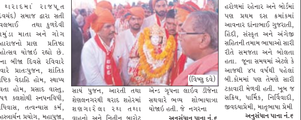
ચરાદ ધારાદમાં રાજપુત (દેવવંદ) સમાજ દ્વારા સતી દેવલબાઈ તથા કુળદેવી ચામુંડા માતા અને ગોગ મહારાજનો પ્રાણ પ્રતિષ્ઠા મહોત્સવ યોજાઈ રહ્યો છે. જેના બીજા દિવસે રવિવારે સવારે પ્રાતઃપુજન, સાંતિક પોષિત વેદાહિ હોમ, સ્થાપ દેવાતા હોમ, પ્રહાદ વાસ, ૧૫૧ ક્વશોથી સ્તુતિવિધી, અધિવાસ, તત્ત્વ્યાસ કર્મ, સહસ્ત્રાર્ચન પ્રયોગ, મહાપુજા, આરતી તથા શેલવનગરથી ચરાદ શહેરમાં સથવારે ભવ્ય શોભાયાત્રા યોજાઈ હતી. જે નગરના વાહનો અને નિતીન બારોટ અનુસંધાન પાના નં.૬