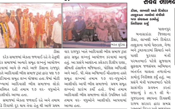
ડીસા વાર રાજપુર ખાતે આદિવાસી ભીલ સમાજ ટ્રસ્ટ દ્વારા સમૂહ લગન આયોજન કરવામાં આવે છે ત્યારે આજે ડીસાના રાજપુર ખાતે આદિવાસી ભીલ સમાજ ટ્રસ્ટ દ્વારા પછા ૧૭ જોડિયાના સમૂહ લગન યોજવા હતા. જેમાં મોટી સંખ્યામાં આદિવાસી ભીલ સમાજના લોકો ઉપસ્થિત રહી તમામ ૧૭ વર-વધુઓને આશીર્વાદ આપ્યા હતા.