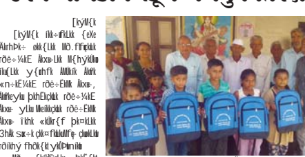
મીઠી ધારિયાલ પ્રાથમિક શાળામાં સરખાવેલ સ્કૂલ બેગનું વિતરણ

મીઠી ધારિયાલ પ્રાથમિક શાળામાં સરખાવેલ સ્કૂલ બેગનું વિતરણ કરવામાં આવ્યું છે. મીઠી ધારિયાલ પ્રાથમિક શાળામાં સરખાવેલ સ્કૂલ બેગનું વિતરણ કરવામાં આવ્યું છે.