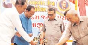
પ્રતિનિધિ અંબાજી ભારતીય બંધારણ સમીતી ના અધ્યક્ષ ડો.બાબા સાહેબ આંબેડકરની ૧૨૦ મી જન્મજયંતી ઉજવવા માટે અંબાજીમાં આંબેડકરની જન્મ જયંતી ભાવે ઉત્સાહ પૂર્વક ઉજવવામાં આવી હતી. મહત્વ ની બાબત તો એ રહી હતી કે અંબાજી ખાતે સૌ પ્રથમ ઉજવાયેલી આ જન્મ જયંતી કોર્ડ પછ ત્રી મી પરમાણી સિવાય બાજપ અને કોંગ્રેસ નાં સ્થાનિક નેતાઓ