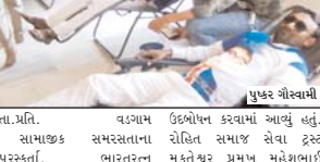
તા.પ્રતિ. સામાજિક સમસતાના ભારતરત્ન ડો.બાબાસાહેબ આંબેડકરની ૧૨૦ મી જન્મજયંતિની વડગામ તાલુકામાં ભવ્ય ઉજવણી કરાઈ હતી. દરમ્યાન મુક્તેશ્વર ખાતે આવેલ બાર પાંદર રોલિટ સમાજની ખાતે ડો.બાબાસાહેબ આંબેડકરની પ્રતિમાને પુષ્પાર્ચવિ અર્પણ કરાઈ હતી. તથા ૧૨૦ મી જન્મજયંતિ પ્રસંગે ભવ્ય ડોનેશન કેમ્પ યોજાયો હતો. કાર્યક્રમના પ્રારંભમાં પ્રાર્થના, ડો.બાબાસાહેબ આંબેડકરની પ્રતિમાને કુલહાર, દિપપાલ્ય, સ્વાગત પીત પછી પ્રસંગિક