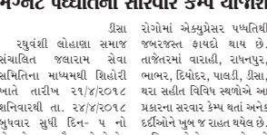
રીસા રોગોમાં એક્સપ્રેસર પદ્ધતિથી સુચવિત જલવાર સેવા સમિતિના માધ્યમથી શિહોરી ખાતે તારીખ ૨૧/૪/૨૦૧૮ શનિવારથી તા. ૨૪/૪/૨૦૧૮ સુધી દિન-૫ નો એક્સપ્રેસર, સુબૅક અને મેગનેટ પદ્ધતિનો સારવાર કેમ્પ સુચવિત લોહાલા મહાજળવાળી, સોનલ સોસાયટી પાસે યોજાઈ છે. આ રામનોદર લોહિલા આરોગ્ય જીવન સંસ્થાને હસ્તાગતમાં પુખ્ત જ નિષ્ણાટ ડોક્ટરો કે.એલ.લોહિલા, જીવલેશિલ્ક, હરવરલસિલ્ક સમિતિના સમગ્ર ટીમ આ કેમ્પમાં સેવા આપનાર છે. બહુ પ્રેસર, ડ્રાપાલસિટ, પેના રોગો, મસા, પશુ, પરવનાના રોગો, જુની મસાનો દુખાવો, સાઈટીકાઈ, લડવો, મેગનેટ રોગો, આંખ, કાન, ગાળાના રોગો, ચીકનગુનિયા, સ્ટ્રી-પુરવના ગુપ્તરોગો સહિત અનેક પ્રકારના