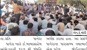
તા.પ્રતિ. ધાનેરા ખાતે ડો.બાબાસાહેબ આંબેડકરની ૧૨૦ મી જયંતિ નિમિત્તે બંધારણ બચાવો દિન તરીકે ગતરોજ રામાપીરના મંદિર બજારમાંથી નીકળી કરવાકા, સુબૅકવચો સાથે રેલી નીકળી હતી. જે રેલી લાવચોક હતી. આ પ્રસંગે આઈ જેલ્લા આચાર્ય ગુપ્તરત્નસુધીચરજી મ.સા. ૪૦૦ સમયામાં સંખ્યાના માર્ગે પ્રસન્ન કરાવશે. માટે જ તેઓ 'દીકાદાનેયરી' તરીકે પ્રખ્યાત છે. જેનું શાસનમાં આ એક વિશિષ્ટ રેકોર્ડ બની રહેશે.